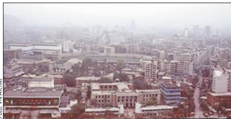
Dicke Luft über Peking – im wahrsten Sinne des Wortes ...

Der Sport-Bravo ist eine Initiative des Landes Vorarlberg und der Sportinformation Vorarlberg. Kürzlich erfolgte im Festspielhaus die Prämierung der siegreichen Sportler, Teams und Schulen. Jetzt haben wir es schwarz auf weiß, was wir insgeheim immer schon geahnt haben: Der Schoren zählt zu den fünf sportlichsten Schulen Vorarlbergs! Bravo Schoren!