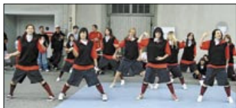
Dies „STROKES“ bei der WM in Bremen.