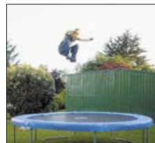
... die Schwerkraft unter sich lassen.

Obwohl die Olympischen Spiele 2008 von den Problemen Chinas überschattet werden, sollten wir uns nicht davon abhalten lassen, den Athleten bei den Wettbewerben die Daumen zu drücken und uns von Olympia 2008 ein eigenes Bild zu machen.