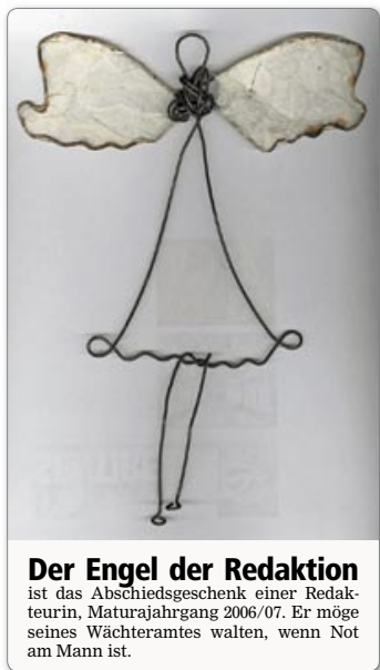
Der Engel der Redaktion ist das Abschiedsgeschenk einer Redakteurin, Maturajahrgang 2006/07. Er möge seines Wächteramtes walten, wenn Not am Mann ist.

„I think this experience was very beautiful. I've met new people and found new friends. The 7b class was very nice with me. A gentle class. I'm very sad that I must go back home, but I'll never forget this experience at Schoren and all the people that I've learnt to know. I say thanks to everybody for the patience they have had with me.“