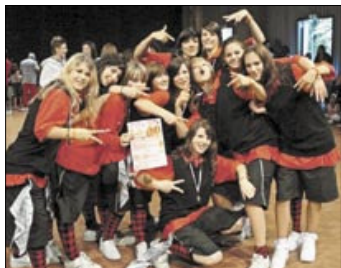
Dies „STROKES“: Schweizer Hip-Hop-Vize-Meister.