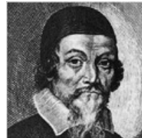
Jan Amos Comenius

Labyrinth Sweta („Das Labyrinth der Welt“), Scholaludus (Die Schule als Spiel); Clavis Janua linguarum reserata („Die geöffnete Sprachentür“); De rerum humanarum emendatione consultatio catholica („Umfassender Vorschlag zur Verbesserung der menschlichen Verhältnisse“), so lauten einige Titel der 250 Schriften von Jan Amos Comenius (eigentlich Ko-