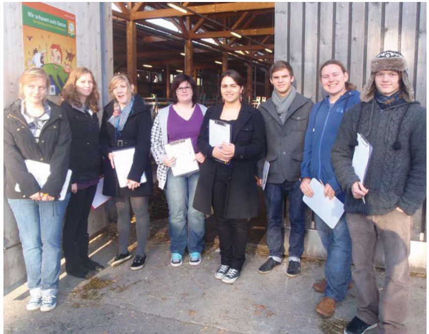
Eine interessante Exkursion führte die BR in die Landwirtschaftsschule nach Hohenems.