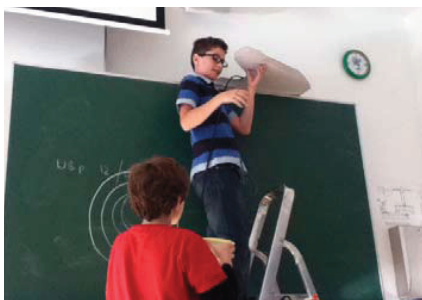
Das Klassenzimmer wird zum Kraftwerk umfunktioniert.