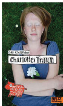
Buchtipps der 4&4.