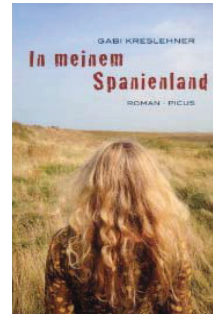
... und ihr Buch.

Finanzen im Auge und wird zur Zuhälterin. Nach einer unsanften Abfuhr von Daniel und dem Selbstmord von Juli steht es schlecht um Carmen. Da ihre Mutter mit ihrem Neuen nach Amerika auswandert, lässt Steffi ihre Tochter bei den Rutschkas, wo sie beinahe jeden Tag sexuell genötigt wird. Am Flughafen, bei Stefis Abreise, trifft Carmen den Inspektor und seinen Liebhaber, welchen sie aus dem Gasthaus des Hammerer Karl kennt. Das Buch endet mit der offenen Frage, ob Carmen bei dem homosexuellen Paar einziehen wird oder nicht.