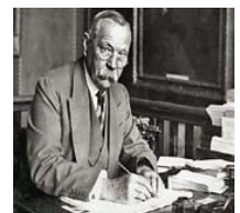
Der Erfinder des berühmtesten Detektivs

Doyle versucht mit seinen Geschichten den Leser glauben zu lassen, dass es Sherlock Holmes und Doktor Watson im realen Leben gibt. Ich finde die Bücher von Sir Arthur Conan Doyle sehr gut