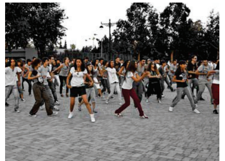
Flashmobs – Plötzlich da, gleich wieder weg.