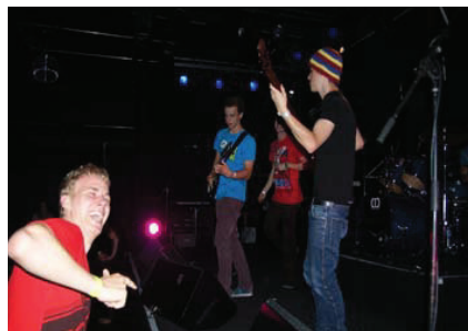
Rocking all over the Schoren.

SPIELBODEN. An diesem musikalischen Spektakel waren auch heuer wieder alle Bands teilnahmeberechtigt, von denen mindestens ein Mitglied Schüler vom BORG Schoren ist. Das Programm war wie immer sehr abwechslungsreich und zeigte einen kleinen, aber feinen Ausschnitt aus