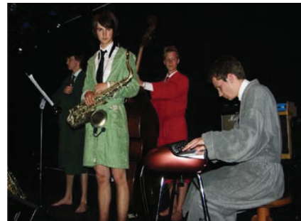
„Codename Hirschgeweih“ rockte in schmucken Bademänteln