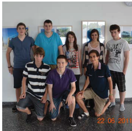
Die Mediendesigngruppe aus der 6i.

S ie halten die 42. Ausgabe der Schoren-Schulzeitung in Händen, ein Produkt mit über zehnjähriger Tradition. Hunderte SchülerInnen haben im Laufe der Jahre an unserer Schulzeitung mitgearbeitet, als BerichterstatterInnen, als ArtikelschreiberInnen, als FotografInnen. Seit diesem Schuljahr ist das Tätigkeitsfeld der LayouterIn dazugekommen. Das heißt, die Schoren-Schulzeitung ist nun ein Produkt, das, unter Begleitung von Lehrpersonen, sowohl inhaltlich als auch formal ausschließlich von SchülerInnen gestaltet wird. Vom Spinnen der ersten Ideen in den Redaktionsitzungen, vom Ringen mit den passenden Formu-