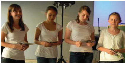
„Making Smile“ aus der 4a1 gewinnen mit ihrem Projekt den Bewerb.