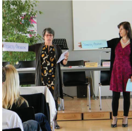
Der pädagogische Tag der Lehrer stand ganz im Zeichen von Most.

Module sind Einsemestrigere Kurse, welche in Wochenstunden angegeben werden. Hier ist sowohl eine schülerautonome als auch eine schülerautonome Schwerpunktsetzung möglich. Also je nach Vorlieben der Schüler und der Schule. Bei der Leistungsbeurteilung selbst sollen neue