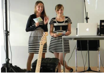
„Die Glühwürmchen“, ebenfalls 4a1, belegen den zweiten Platz.