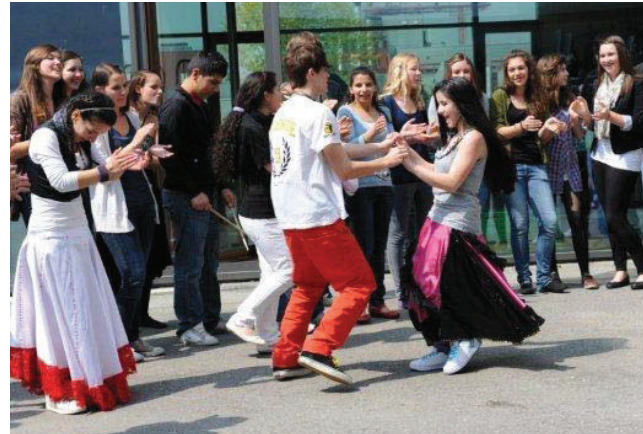
Unsere Freunde aus der Slowakei tanzen, wir klatschen und singen.