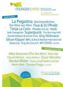
Das offizielle Plakat des Festivals.